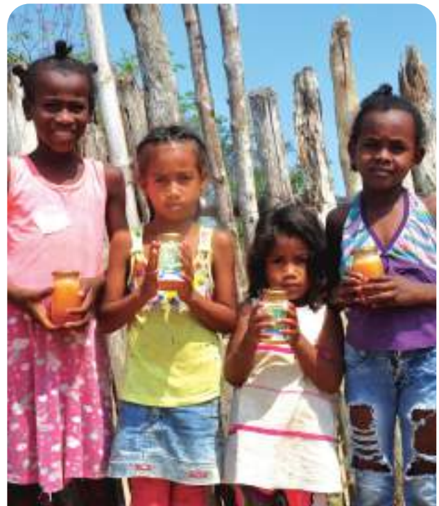
Apicultura en Parques Nacionales, Colombia

Hoy en día, la pesca excesiva y las prácticas de tala perjudiciales en la zona han cesado y la comunidad participa en un esfuerzo anual de plantación de manglares. Y Sebastien ha trabajado con las comunidades para crear una microempresa apícola que ayuda a mantener a las comunidades mediante la venta de miel en ciudades como Cartagena.