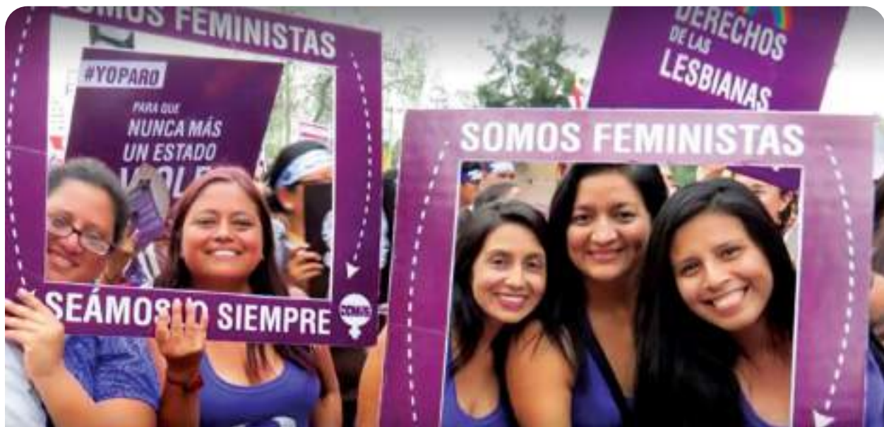
Somos Feministas, Lima, Perú