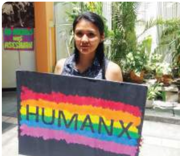
Lima, Peru

Aunque los Pueblos Indígenas representan aproximadamente el 6 por ciento de la población mundial, constituyen el 19 por ciento de los más pobres. Mejorar la seguridad en la tenencia de tierras, fortalecer la gobernanza, promover inversiones públicas en servicios de alta calidad y culturalmente apropiados, y apoyar los sistemas indígenas para la resiliencia y los medios de vida son fundamentales para reducir los aspectos multidimensionales de la pobreza. Los programas de Cuso apoyan a los Pueblos Indígenas y comunidades de manera que reflejan sus voces y aspiraciones.