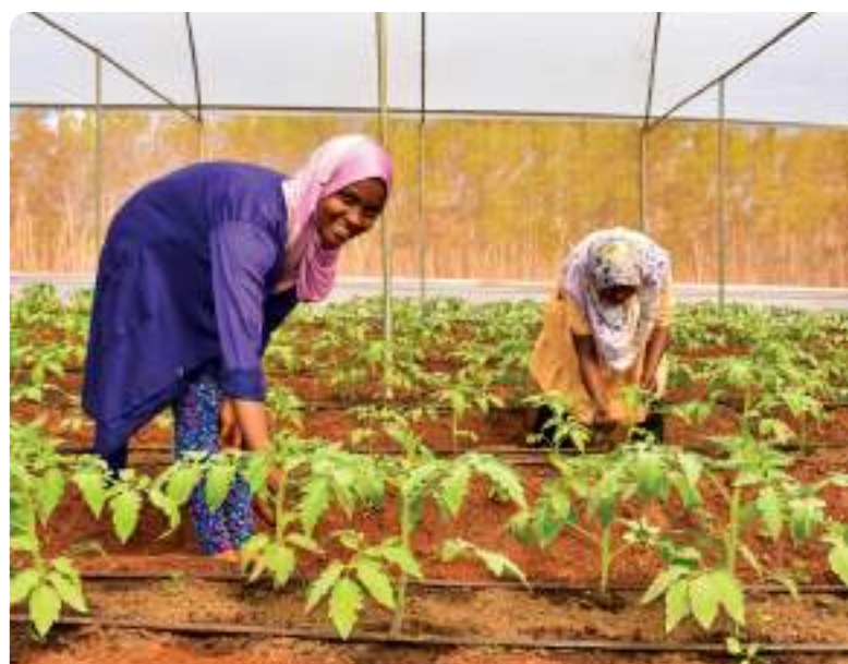
Estudiantes participando en el proyecto del Modelo de Negocio Kizimba, región de Morogoro, Tanzania.

Tres voluntarios de Cuso ayudaron a la Abilities Foundation en este proyecto, que en 2021 recibió el primer lugar en Jamaica 4-H Agriculture Technology Innovation Competition. Este proyecto ahora se está expandiendo a través de los clubes 4-H de Jamaica para alcanzar a una población escolar aún más amplia.